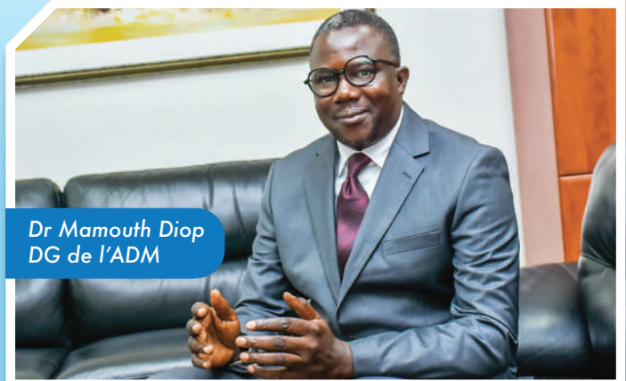
Dr Mamouth Diop DG de l'ADM

Notre force : Une équipe de 50 agents spécialisés dans le développement territorial, au service des collectivités territoriales depuis plus de 25 ans.